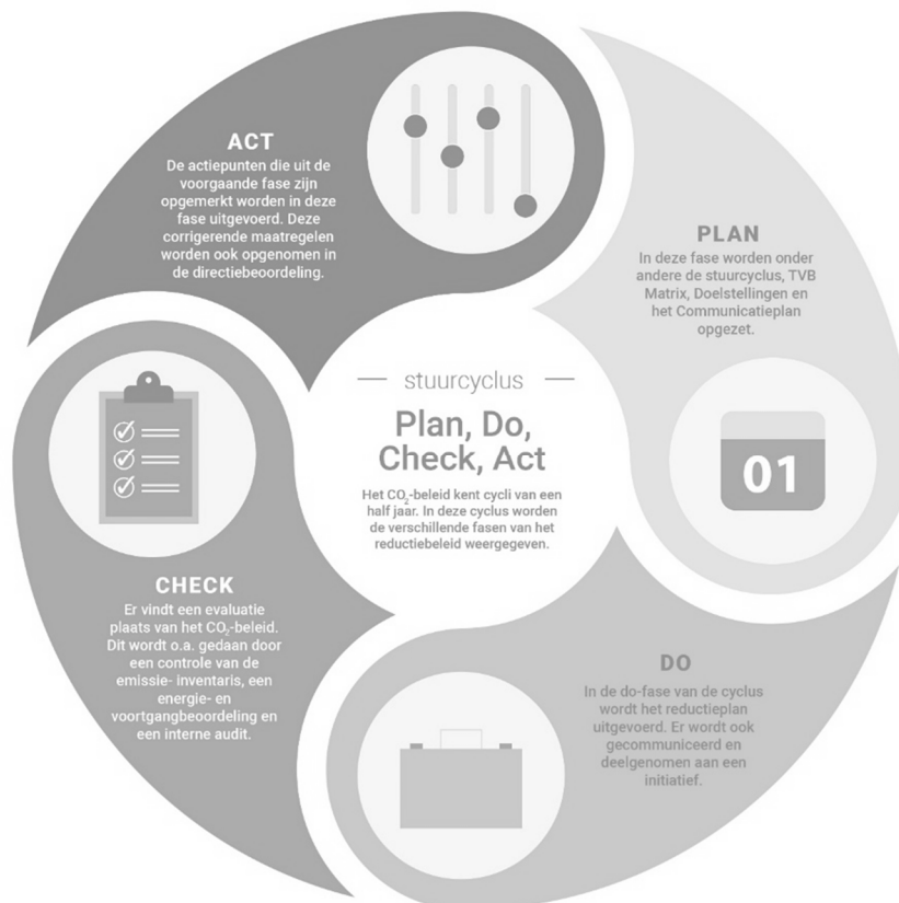
Figuur 1: PDCA-cyclus

Vervolgens wordt beoordeeld of sturing op de doelstelling en maatregelen nodig is, in de vorm van het aanscherpen van de doelstelling wanneer deze (te) eenvoudig behaald wordt, of in de vorm van het nemen van extra maatregelen wanneer bepaalde maatregelen niet mogelijk bleken te zijn en de doelstelling niet gehaald dreigt te worden. Hierover wordt vervolgens intern en extern gecommuniceerd. Daarnaast wordt de nuttige toepassing van het sector- of keteninitiatief in de afgelopen periode geëvalueerd. Hieronder is een zogenoemde PDCA-cyclus weergegeven, waarin de verschillende fasen van het CO 2 -reductiebeleid zijn weergegeven.